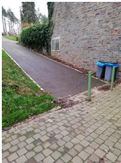
Aan de achterkant van het gebouw