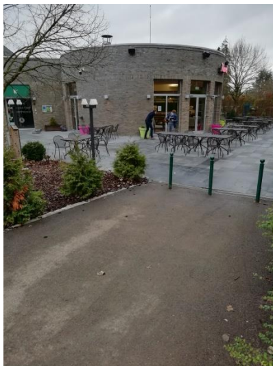
Tegenover de hoofdingang